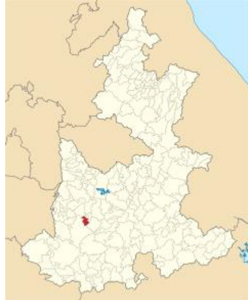
Mapa 1. Ubicación del municipio