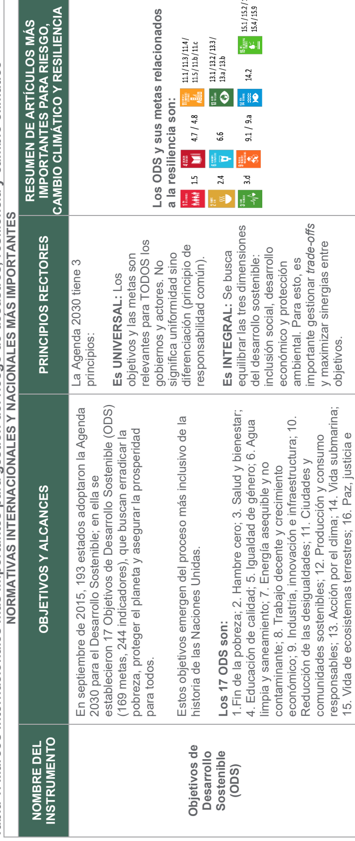
Tabla 1. Marcos internacionales más importantes para gestión del riesgo de desastres, resiliencia y cambio climático NORMATIVAS INTERNACIONALES Y NACIONALES MÁS IMPORTANTES

El marco legal que se presenta a continuación resume los puntos más relevantes de los instrumentos internacionales más importantes para los temas de gestión del riesgo de desastres, resiliencia y cambio climático. Estos instrumentos establecen los estándares en la materia y han sido todos adoptados y ratificados por México; con lo cual, forman parte del marco legal mexicano. Además, se presenta el resumen de las principales leyes nacionales y generales de la temática.